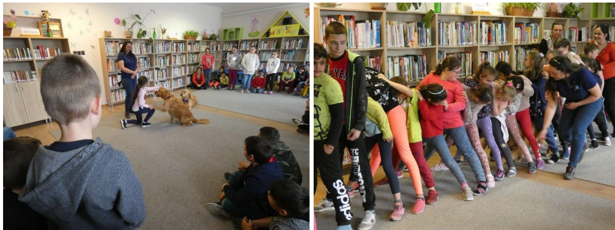
Aktív Mancsok a csanyteleki könyvtárban

Csanyteleki kolléganőnk tartott olvasást és szövegértést fejlesztő könyvtári órákat, könyvtárhasználati foglalkozásokat, vetélkedőket, digitális kompetenciát fejlesztő foglalkozásokat.