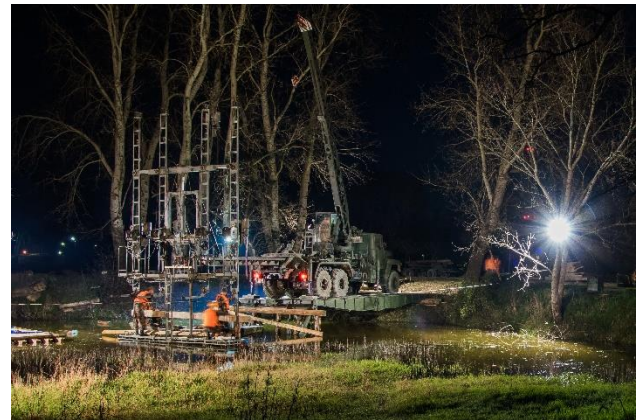
Munkában a Harminchetesek

lehessen, mit is tudnak a szentesi katonák.