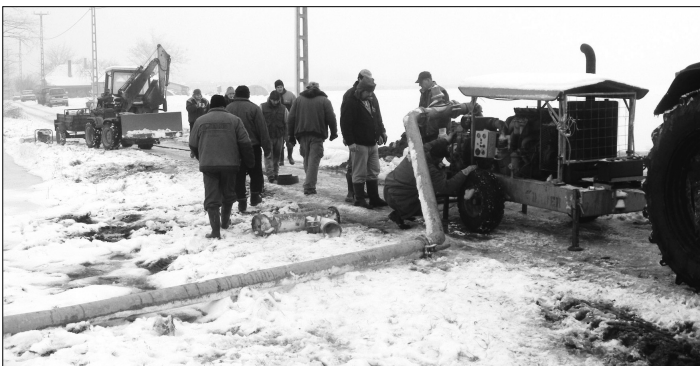
Szivattyúzás a Szegedi úton.