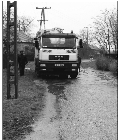
VOMA zárt csatorna tisztítás.

A most életveszélyessé vált házak esetében két közös jellemző volt megfigyelhető: egyrészt szinte valamennyi esetben az északi-északnyugati homlokzat sérült, másrészt szinte egyiknél sem volt esőcsatorna. Könnyen belátható, hogy ha a településünkön uralkodó északi-északnyugati szél „ráveri” az esőt – ami az elmúlt 12 hónapban több, mint 1200 milliméter volt a szokásos 450–650 milliméter helyett – a falra, az közvetlenül a „fal tövébe” csurog, ugyanúgy, mint a tetőfelületről, a „keskeny ereszről” lecsorgó esővíz is! Ha kiszámolnánk, meglepődve tapasztalnánk, hogy ha a sík felületre 1300 milliméter csapadék hullott, akkor a „fal