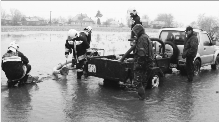
Szivattyúzás a Szent László utcában.

...és még nincs vége! A múlt év december 2-án kezdődött harmadfokú belvízvédelmi készültséget 53 nap után, január 24-én másodfokúra mérsékeljük ugyan, de a szakemberek egybehangzó véleménye szerint nincs még vége a belvízveszélynek.