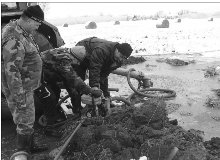
Szivattyúzás az Arany János utcában.