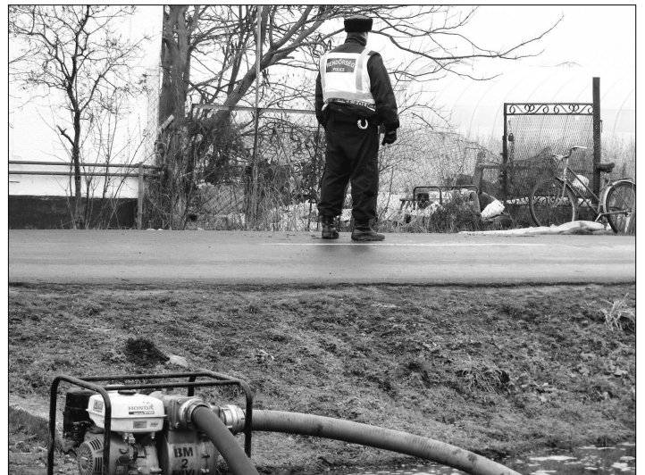
Szivattyúzás a Pusztaszeri úton.