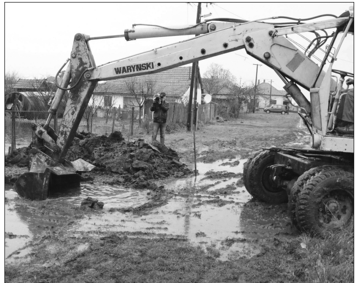
Vízvezető árok nyitás a Pókföldön

Mivel a talaj felső 1–1,5 métere 100 százalékban telített vízzel – a falu alatti belvízkúp szintje minden eddigi mért értéknél 250 milliméterrel magasabb –, továbbá a levegő páratartalma hosszú ideje 96–98 százalékos, a „fal tövéhez” hullott extra mennyiségű esővíz fölszí-