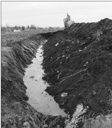
Csatorna nyitás lefolyástalan területről.

védik a falba, ráadásul meg is fagy, netán többször is, mint ahogy most történt, ez különösen romboló hatású. (Gondoljanak csak a réti mélyszántásra, hogy szokott kinézni szántás után, illetve milyen morzsalékosá válik az tavaszra, mert a fagy „szétszívja” a rögöket.)