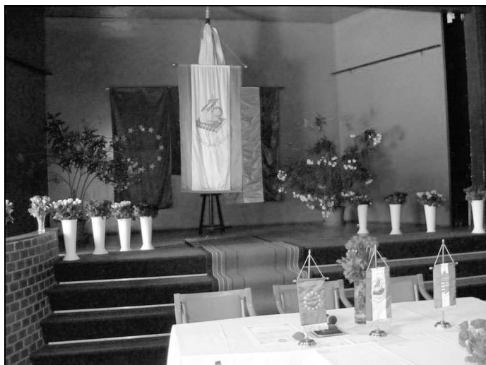
Ünnepi testületi ülés