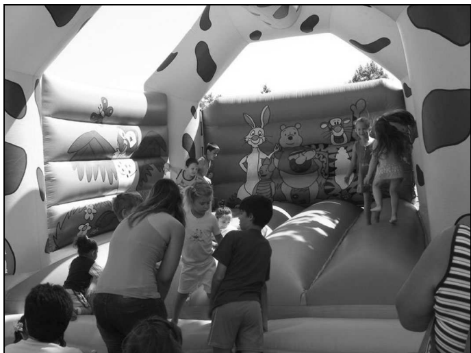
Az ugrálóvár is sokakat vonzott