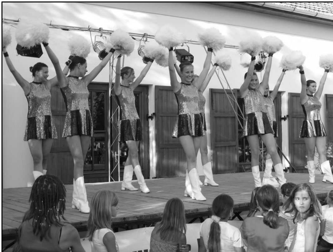
Majorettek a színpadon