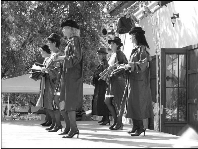
Intézményi dolgozók is szerepeltek