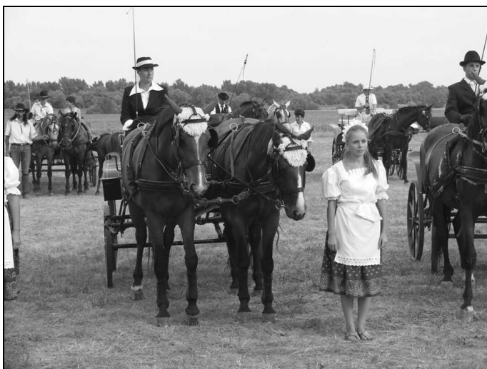
Tizsakécskei Lovas Egyesület