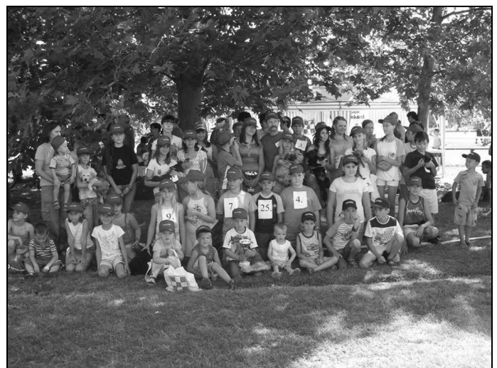
Nagy sikere volt a kisállat szépségversenynek