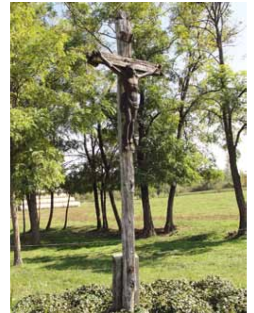
Dögállási kereszt, Csanytelek közigazgatási területén

templomának helyét. „ Túlélte ” még a Dong-ér szabályozását is: ott állt a Tisza közelében, a Dongér-csatorna jobb oldali gátján kívül, a baksi oldalon. Nagyapáink Madarasi Köröscsüt néven is emlegették.