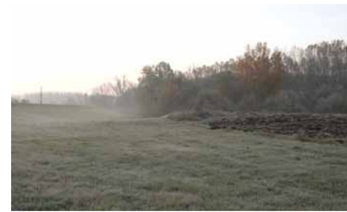
Középen a domb a dongéri kereszt helye, Baks közigazgatási területén

A váci püspöknek 1891-ben küldött plébániai jelentésében szerepel a „ Huszka-féle dongéri fakereszt (amely 63 forint 15 krajcár alapítvánnyal az 1840-es években készült). 1867-ben már felújítást igényelt .” Ezt a feszületet annak a keresztnek a helyére állították, amely a középkor vége óta mutatta a Kis-mindszenti országúton haladóknak az ősi Tömörkény falu