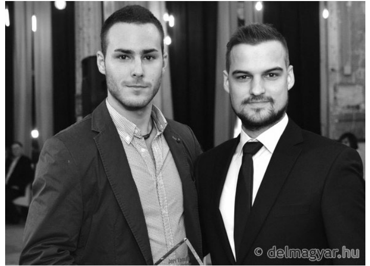
Részlet a Délmagyarország 2016. 12. 20-i cikkéből.

- Nehéz egy olyan szakágat abbahagyni, amiben csúcson vagy, de az olimpia miatt megéri. Ugyanazzal a fegyverrel kell lőni, de másféle korongokra, ezért teljesen máshogy kell készülnöm. Eddig autodidakta módon gyakoroltam, így kíváncsian várom, milyen lesz Igaly Diával együtt dolgozni. Ő úgy lőtt világcsúcsokat, hogy edzésen nem jött össze neki semmi, én is ilyen típus vagyok. A sportlövészetet amúgy csak négy éve kezdtem, előtte tizenkét évig versenytáncoltam, ami sokat segít a ritmusérzékben - mondta.