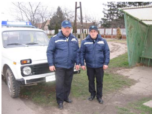
Itt tartóztatták fel a polgárőrök a február 18-i rablás elkövetőinek egy részét