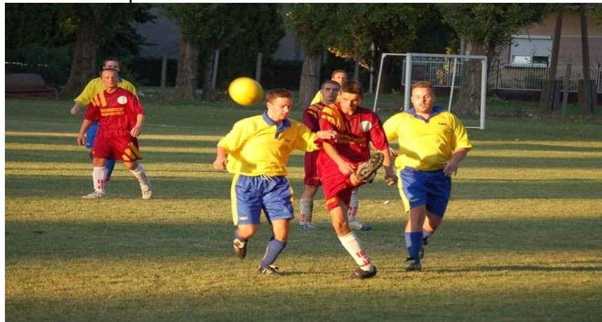
A csanyteleki küzdőszellem 3 pontot ért Fábiansbestyénben